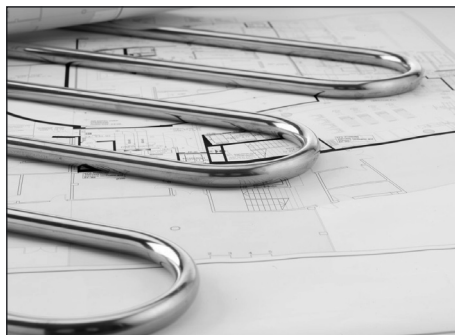
Na sestavě se nejlépe kontroluje dodržení přesnosti

umožňující jim lepší vstup do jejich odborné profese. Podobné je to i v ostatních kategoriích soutěže, ve kterých jsou zastoupeny ostatní instalační materiály.