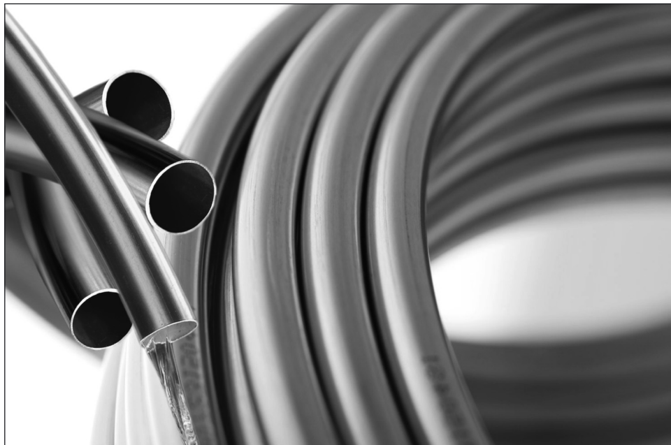
Tím, že jsou měděné trubky tenkostěnné, mají malý rozměr přes povrch. To umožňuje jejich snadné zabudování.

Soutěž je pořádána Cechem topenářů a instalatérů ČR, Ministerstvem školství, mládeže a tělovýchovy ČR a Střední školou polytech-