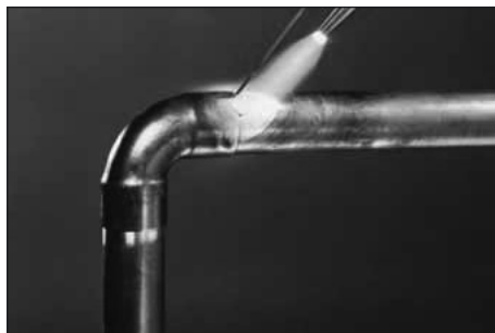
U pájených spojů se projeví zručnost páječe

nickou, Brno, Jílová 36g. Je pochopitelné, že samotná soutěž je umožněna podporou sponzorů. Ti se rekrutují jak z řad velkoobchodů, tak také i z řad výrobců a dodavatelů komponentů pro obor technických zařízení budov. Jako příklad uvádím, že v loňském roce byla pro praktickou část, týkající se měděných rozvodů poskytnuta od Střediska mědi a jejích členů podpora, která činila celkem 435 metrů měděných trubek a 1 114 ks měděných tvarovek. Středisko mědi dále každoročně uděluje finanční ocenění pro tři nejlepší učně, kteří dostanou v soutěži jednotlivců v kategorii měď za I. místo 3 000 Kč, za druhé 2 000 Kč a za třetí místo je to 1 000 Kč. Peněžité ceny jsou udělovány formou poukázek, za které si mohou vítězové nakoupit nářadí a materiál,